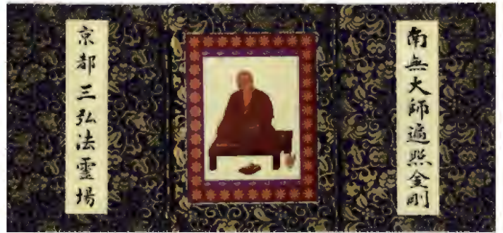
京都三弘法「ご朱印帳」