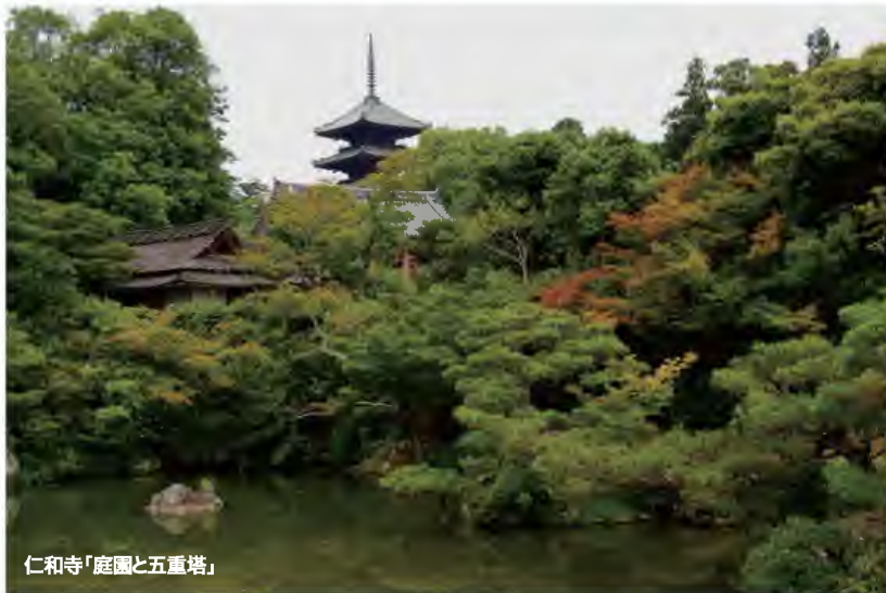
仁和寺「庭園と五重塔」