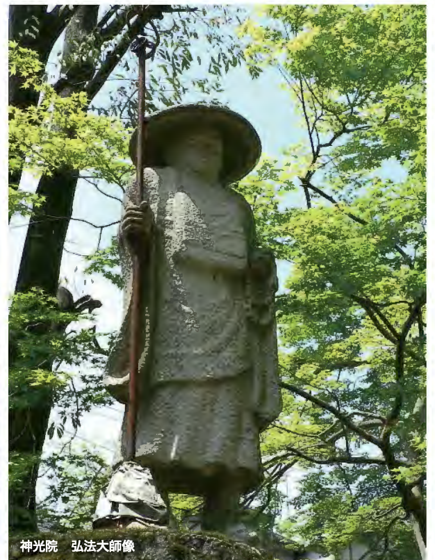
神光院 弘法大師像